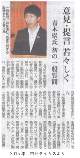
2015年 市民タイムスより

若者世代の85%が松本市での暮らしに満足し、70%が今後も継続して松本に住み続けたいと回答している。一方で、老後の暮らしや金銭的、経済的なこと、子育てに関する悩みを持っていることが明らかとなり、働きながら安心して子育てできる環境整備が一層求められる結果となった。これは地方創生の視点からも大変重要であるため、今回の調査結果や浮かび上がった課題について、早急に分析し、スピード感を持って施策を展開していくことが必要と考えている。