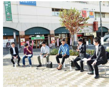
まちなか討論会で話題になった「政治への不信感」を議場で質問

松本市ではこれまで、若者の意見を出来る限り市政に反映してきたが、残念ながら若者の多くにおいて、その政治関心が低いことが現状である。対策として、時間がかかっても子どもの頃からの主権者教育をすることが不可欠である。そして、学校だけでなく、地域や家庭でも、小・中・高校生や若者を主権者へ育てるべく、関わっていくことが大切である。また、行政からの情報が若者に届いていない現状も課題であるため、若い世代が情報を入手しやすい、有効な手段によって情報を発信していくことを研究し、進めていく。私が若い世代に伝えたい事は、社会に関心を持ち、まちづくりや消防団、ボランティア活動等に出来る限り参加して欲しいということだ。実際に社会活動に携わることは、机上で考える事とは違うリアルな課題を発見することができ、それは課題を共有する仲間づくりにつながり、結果としてそれが若者の政治参加を進めることになるかと考える。そして、私は機会あるごとに、自らの体験したことや人生への思いを若者に語りかけてきたが、これは私の大切な役割だと考える。また、若い世代から政治家を目指す覚悟をもった人材が出てくることを大いに期待しているため、昨今の政治家に対するマイナスのイメージを少しでも払拭していくことも私の役割であると考えている。そして、このことは議員のみならず含めすべての政治家が、自らの政治姿勢を振り返りつつ、己に厳しい意識を持たなくてはならないことだと考えている。